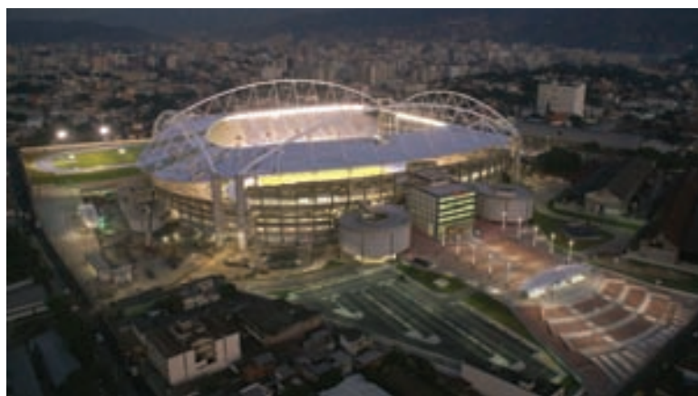
Estádio João Havelange: a TA esteve presente no PAN Rio 2007

de água enquanto que os mais distantes, no sentido inverso, terão quantidades insuficientes para atender suas demandas. Nos sistemas de ar condicionado isto redundará em maior consumo de energia, devido a problemas no controle do sistema, maior exigência do bombeamento e diminuição do nível de conforto térmico que obriga os usuários a mudarem o ponto de operação. Em sistemas de água quente sanitária irá diminuir o conforto e aumentar o gasto de água uma vez que nos pontos mais próximos teremos excesso de água quente, dificultando o ajuste do misturador, e nos circuitos mais distantes, uma demora na chegada da água quente.