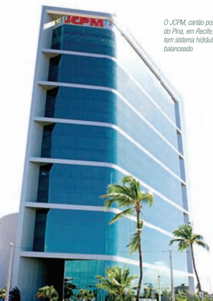
O JCPM, cartão postal do Pina, em Recife, tem sistema hidráulico balanceado

Confira, nas páginas seguintes, como a TA pode contribuir para a sustentabilidade do seu próximo projeto e, também, como pode agregar esta qualidade às edificações existentes, através do retrofit das instalações.