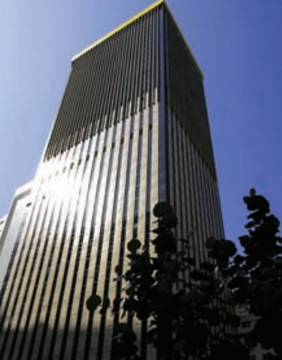
No Rio de Janeiro, a sede do Banco do Brasil destaca-se pela tecnologia; também lá a TA se faz presente