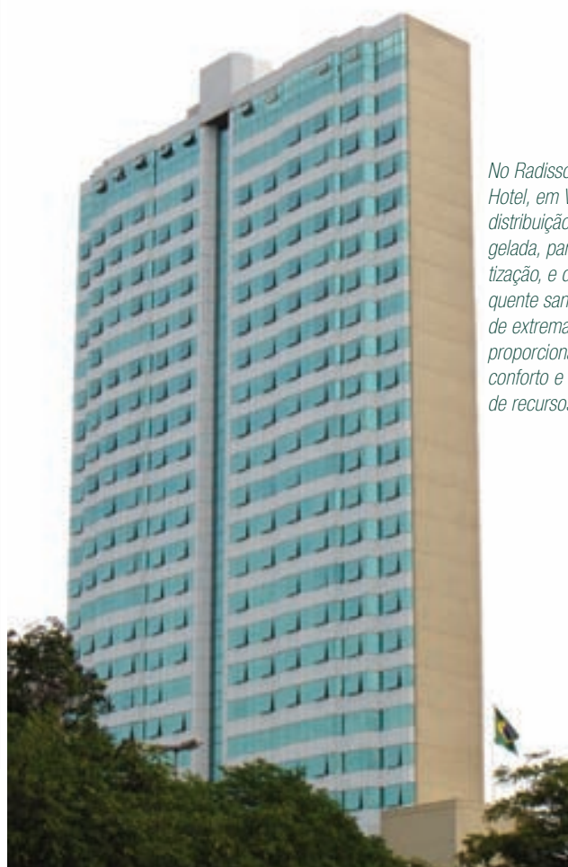
No Radisson Hotel, em Vitória, a distribuição de água gelada, para a climatização, e da água quente sanitária, é de extrema precisão, proporcionando conforto e economia de recursos