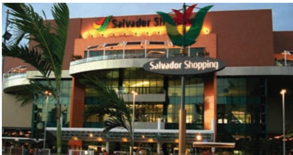
O mais moderno shopping center do Brasil tem balanceamento hidráulico TA

L íder mundial em balanceamento hidrônico, a TA fabrica componentes de hidráulica desde 1897. Suas válvulas de balanceamento, de controle de vazão, misturadoras, de circulação e equalização, além de outros componentes, controles e sistemas, equipam os maiores empreendimentos do mundo.